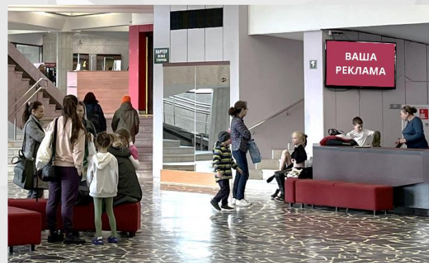
Фойе 1-го этажа